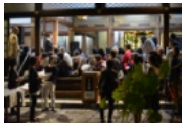
主催者代表による挨拶