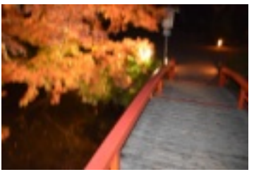
紅葉のライトアップ