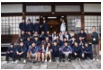
本堂前で集合写真