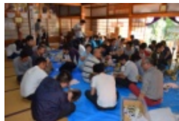
学院生によるおみぎ